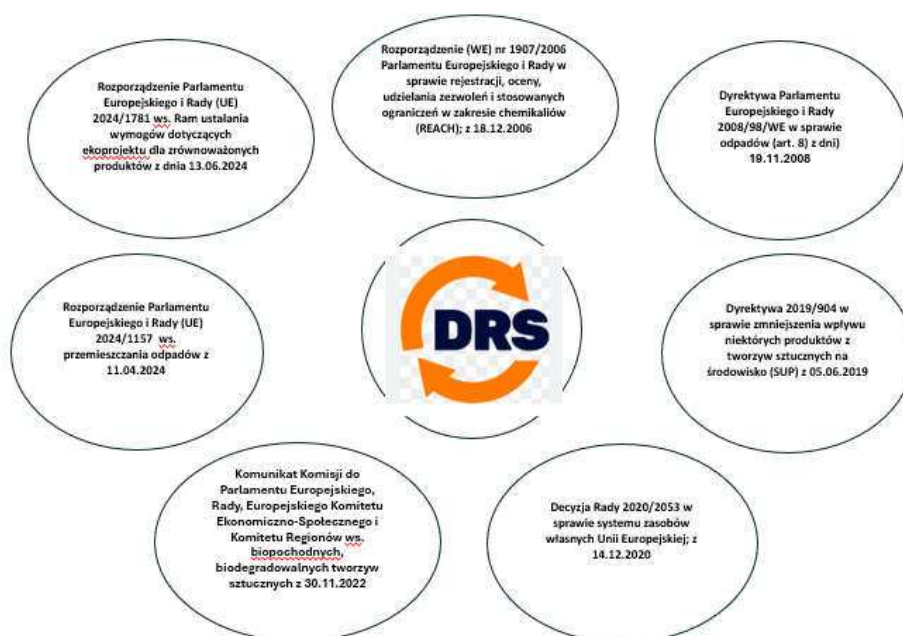
Rysunek 1. Otoczenie regulacyjne DRS

DRS obejmuje wiele aktów prawnych. Ich zakres został przedstawiony na rys. 1: