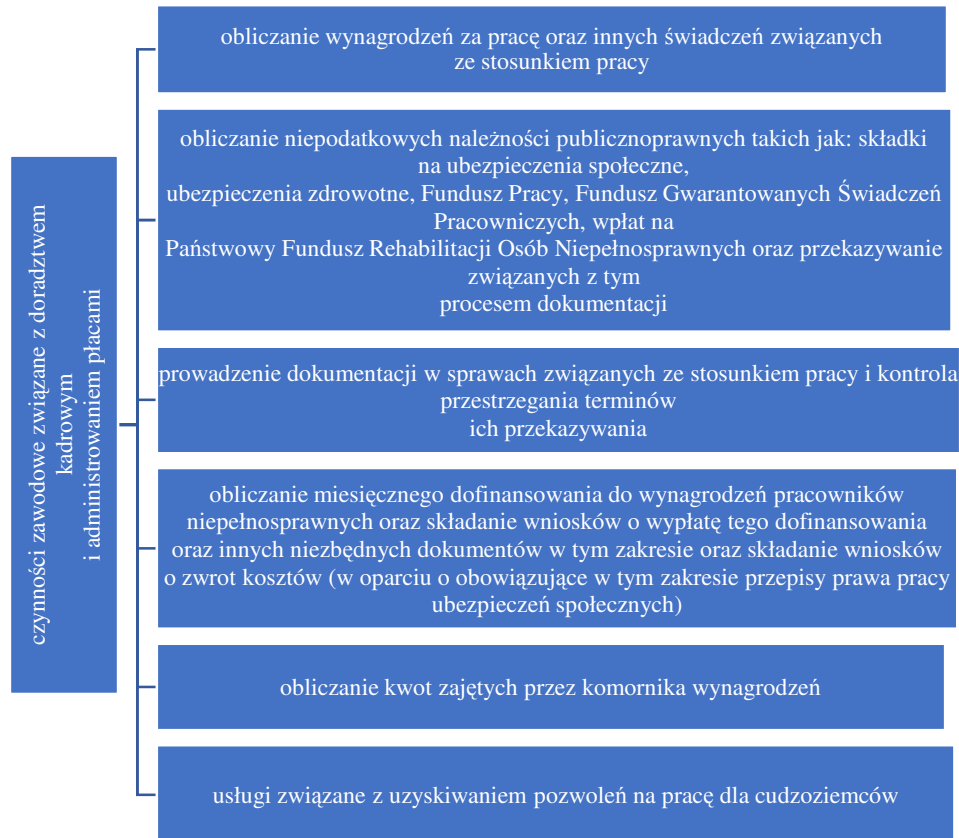
Rys. 3. Podział czynności zawodowych związanych z doradztwem kadrowym i administrowaniem płacami